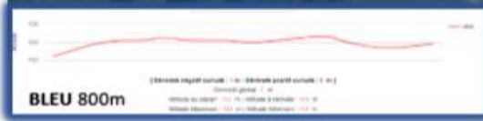
Topographie des parcours :